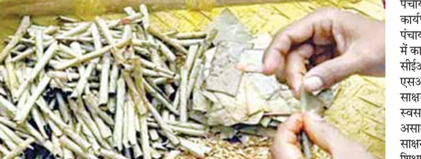
खिलवाड़ किया जा रहा था।

उमरिया। बिरसिंहपुर पाली नगर के व्यापारिक गलियारों में इन दिनों नकली के कारोबार ने हड़कंध मचा रखा है। ब्रांडेड कंपनियों के नाम पर जहर बेचने का धंधा बिरसिंहपुर पाली की तीन प्रतिष्ठित दुकानों में बेधडक संचालित हो रहा था। जब कंपनी के कर्मचारियों ने खुद दबिश दी, तो भारी मात्रा में नकली बीड़ी का जखीरा बरामद हुआ, लेकिन चौकाने वाली बात यह है कि इस गंभीर अपराध को पुलिस की चौखट तक ले जाने के बजाय बंद कमरों में समझौते की चादर ओढ़ाकर दबा दिया गया। सवाल यह उठता है कि क्या रसूखदार दुकानदारों के सामने कानून बौना साबित हो रहा है।